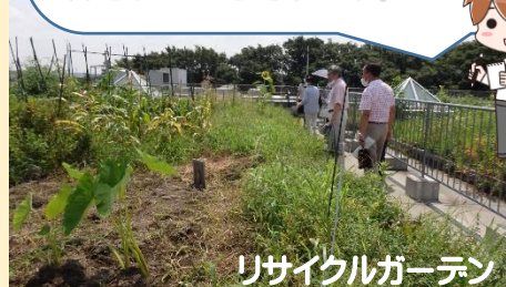
リサイクルガーデン

屋上では太陽光パネルやボランティアさんがきれいに手入れされたリサイクルガーデンなどが見学できます。高さ 59mの煙突は航空灯の設置義務のないぎりぎりの高さに設計されているそうです。