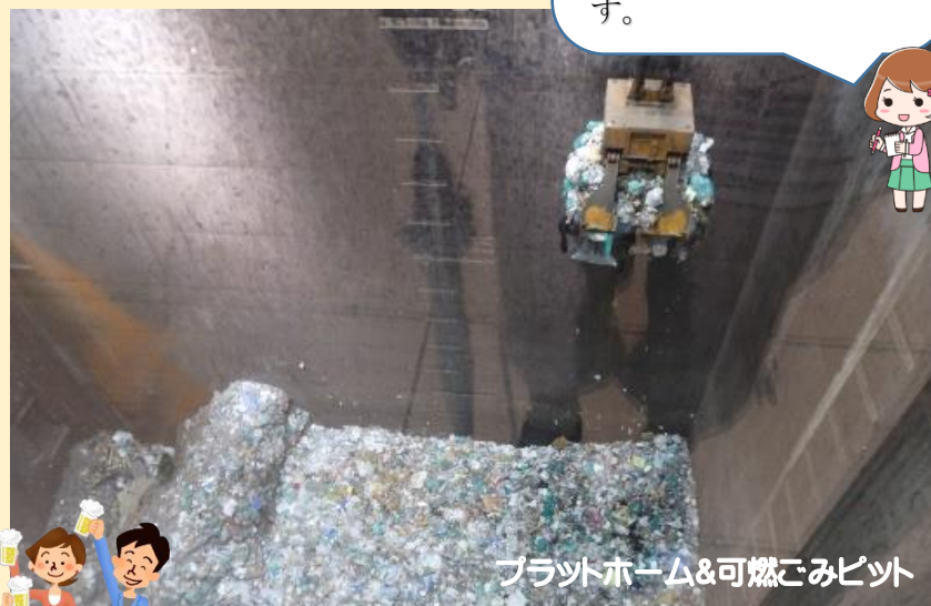
プラットフォーム&可燃ごみピット