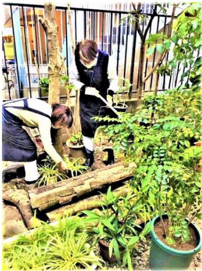
年末に大掃除を行いました。