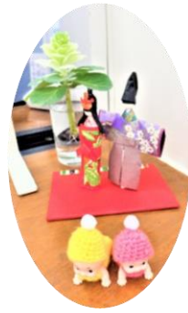
エントランスやお部屋の入口では春らしい花々がお迎えいたします。