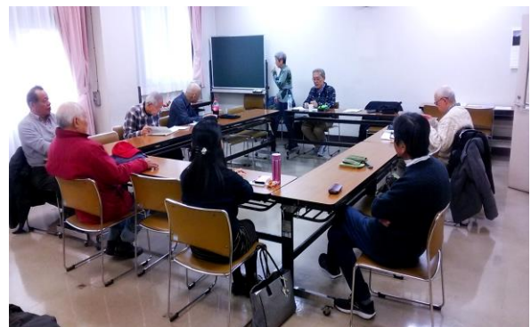
ある日の「例会」風景です

当コミセンにて毎月第2および最終土曜日の午後開催していますので、一度気軽に覗きにきてみませんか。