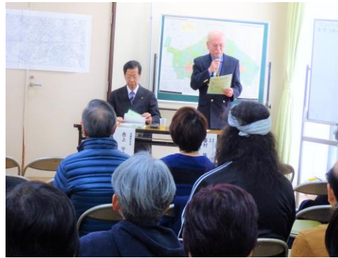
コミュニティの未来を考えましょう