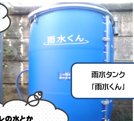
雨水タンク 「雨水くん」