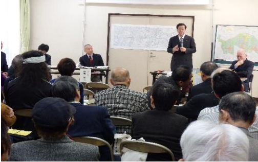
多様な市民の力をコミュニティに生かそう